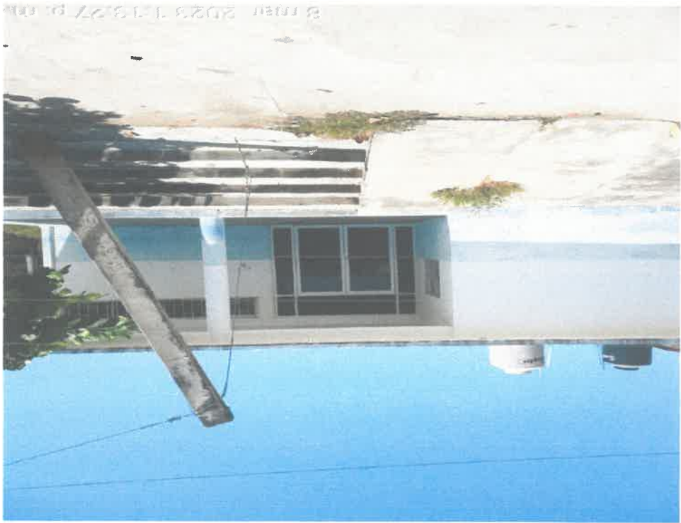
CERROO DE LAS TABLAS