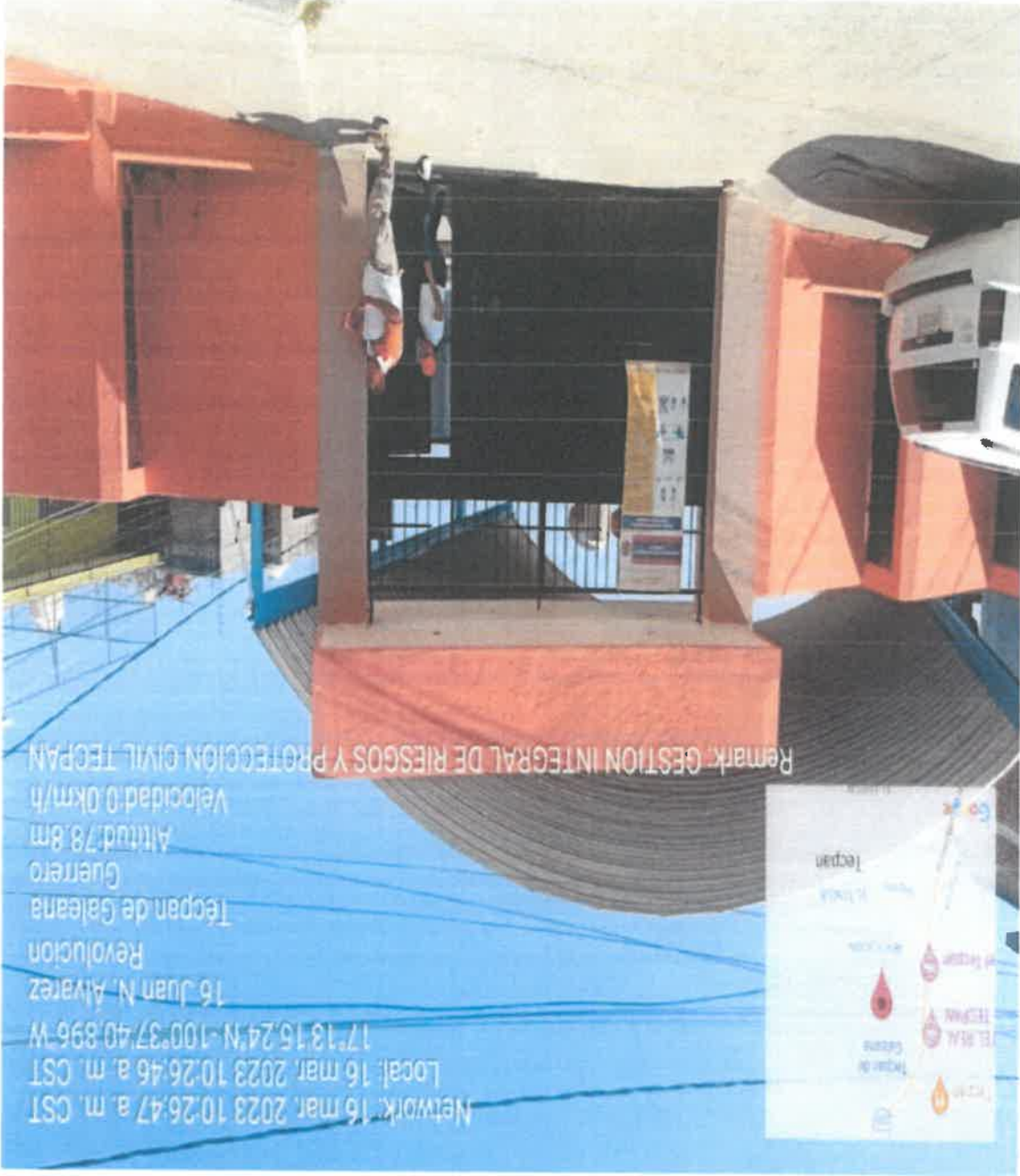
ESCUELA PRIMARIA URBANA REVOLUCION