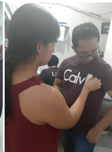
Entrega de distintivos