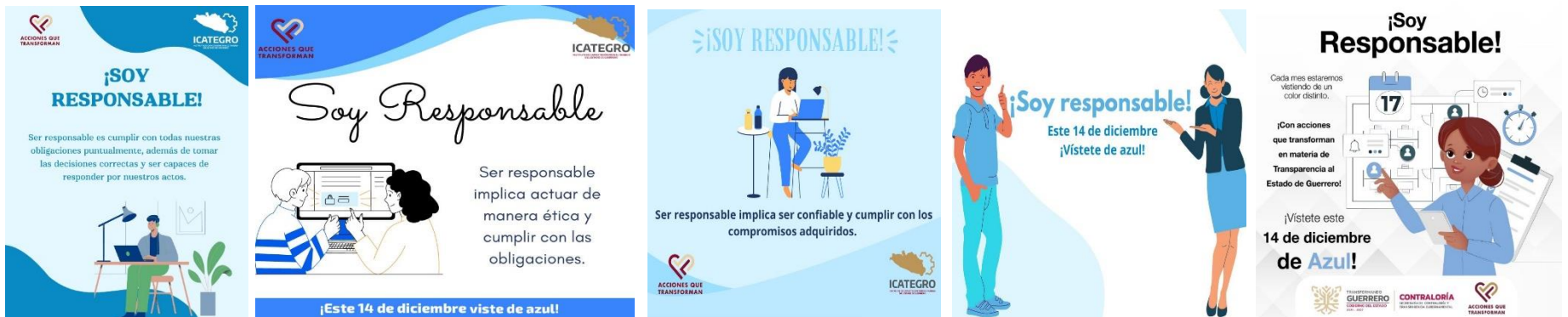
Infografías compartidas en grupo de WhatsApp institucional del ICATEGRO.