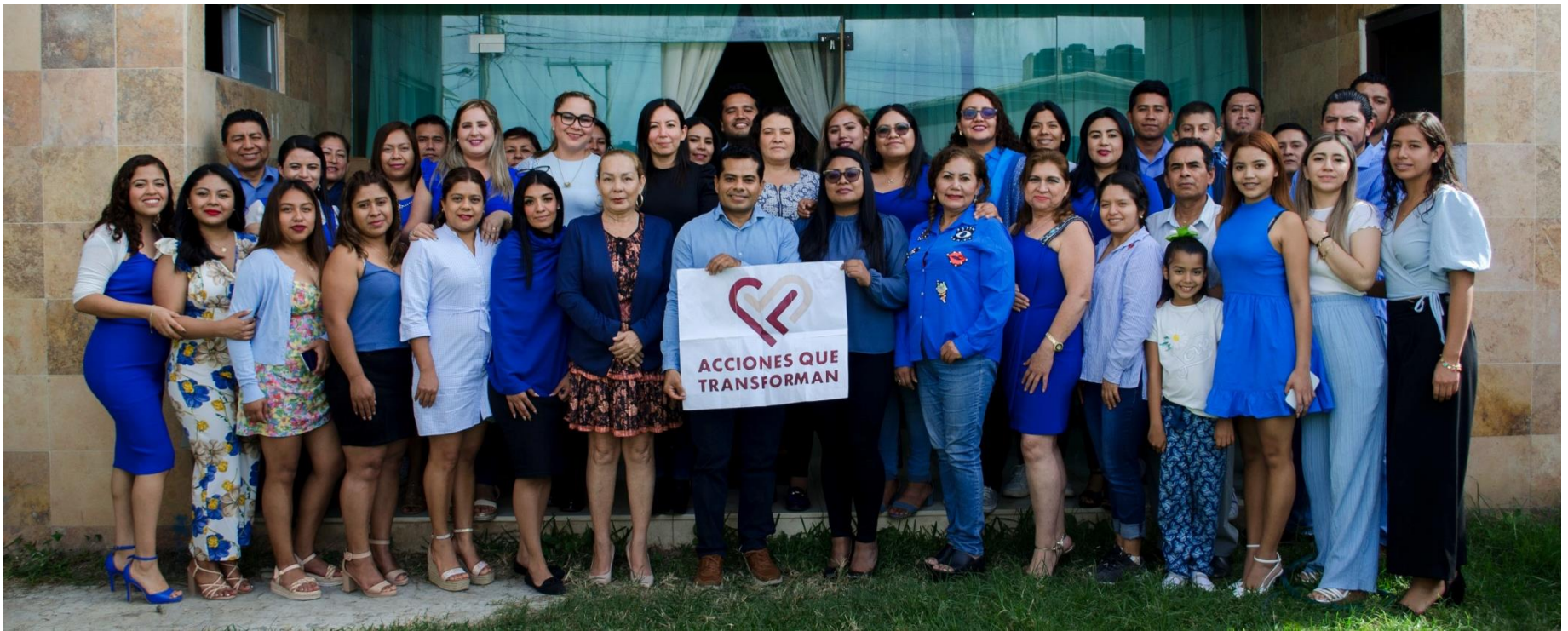
Fotografía institucional del personal sumándose a la campañas “Acciones que Transforman” con la temática ¡Soy Responsable!