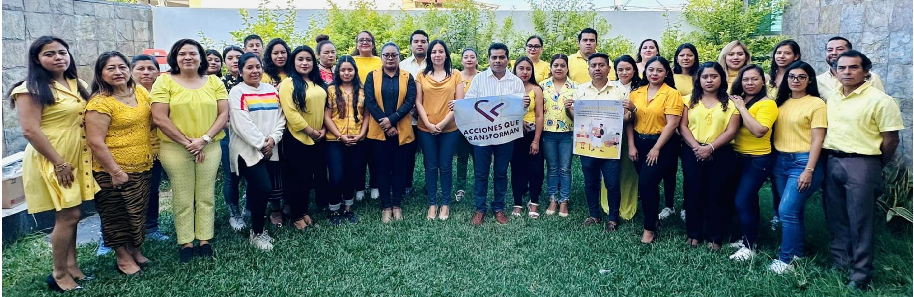
Fotografía institucional del personal sumándose a la campañas "Acciones que Transforman" con la temática ¡Solidaridad!

En el mes de noviembre la Secretaría de Contraloría y Transparencia Gubernamental , cambio la temática del mes de noviembre de "SER JUSTO" a "SOLIDARIDAD" , debido a la catástrofe ambiental ocurrida 25 de octubre de 2023 y como muestra de apoyo a nuestras costas del estado de Guerrero.