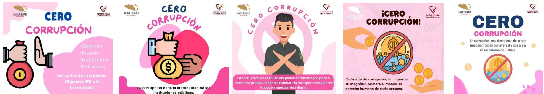
Infografías compartidas en el grupo de WhatsApp institucional del ICATEGRO.