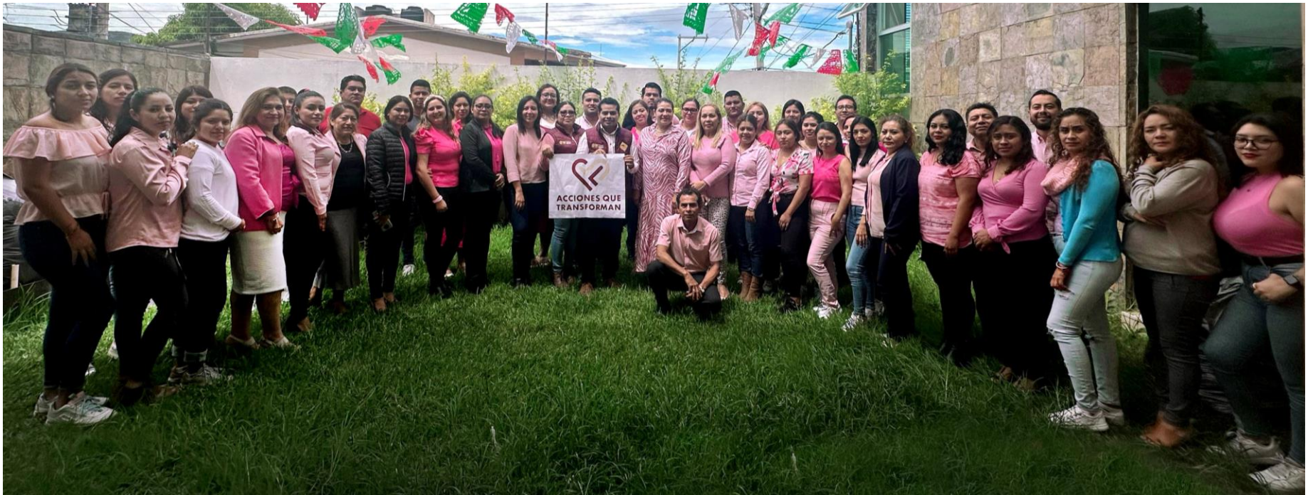
Fotografía institucional del personal sumándose a la campañas “Acciones que Transforman” con la temática ¡cero corrupción!