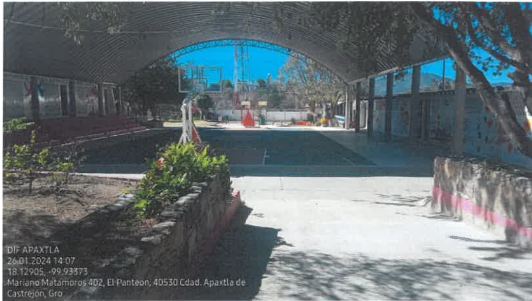
DIF APAXTLA 26.01.2024 14:07 18.12905, -99.93373 Mariano Matamoros 402, El Panteon, 40530 Cdad. Apaxtla de Castrejon, Gro