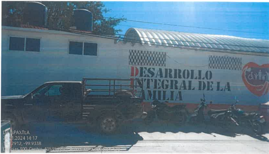
DIF APAXTLA 26.01.2024 14:17 18.12912, -99.9338 Dif. Cajas 300, Centro, 40530 Cdad. Apaxtla de Castrejón, Gro