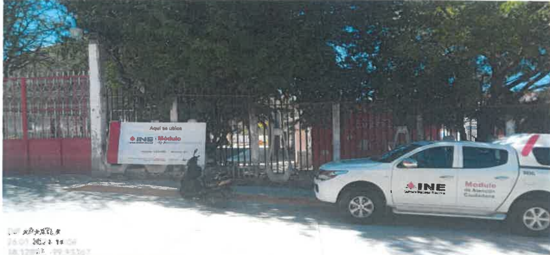
DIF APAXTLA 26.01.2024 14:04 18.12894, -99.93307 Mariano Matamoros 402, El Panteón, 40530 Cdad. Apaxtla de Castrejón, Gro