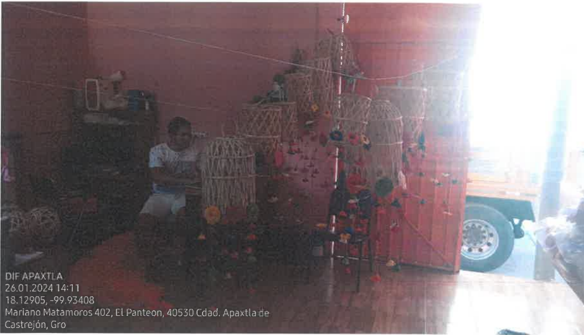
DIF APAXTLA 26.01.2024 14:11 18.12905, -99.93408 Mariano Matamoros 402, El Panteon, 40530 Cdad. Apaxtla de Castrejón, Gro