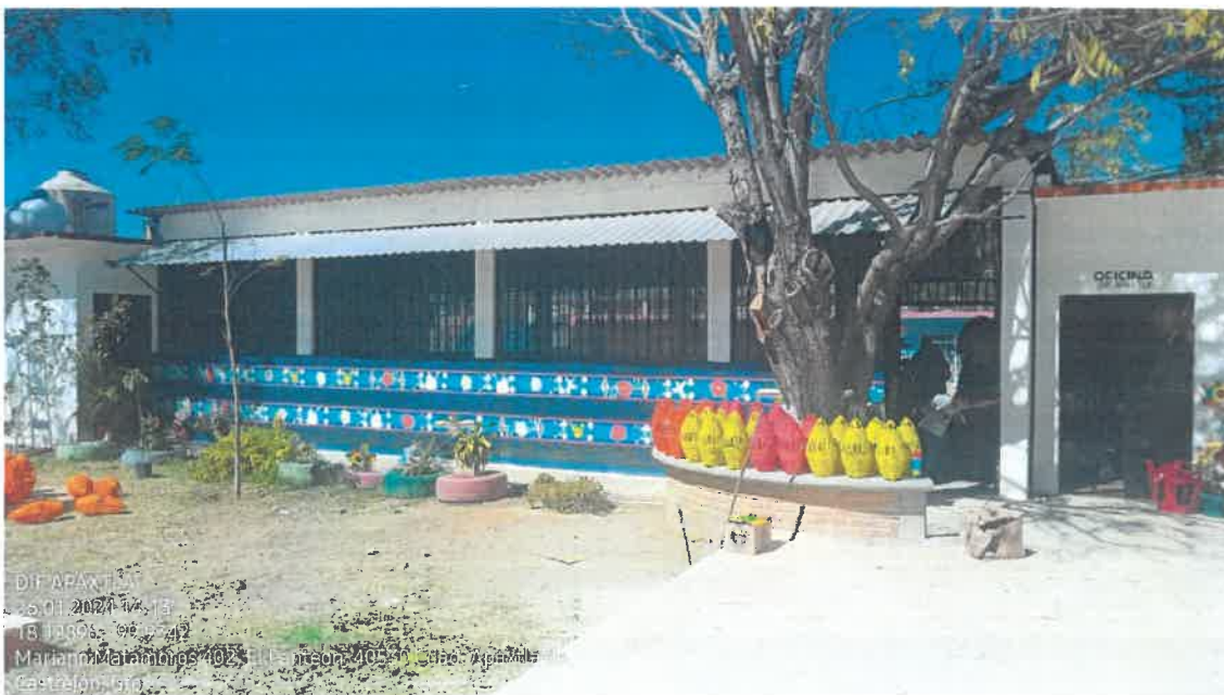
DIF APAXTLA 26.01.2024 14:18 18.12905, -99.93373 Mariano Matamoros 402, El Panteon, 40530 Cdad. Apaxtla de Castrejon, Gro