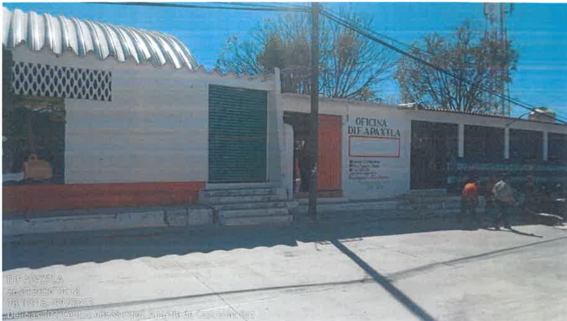
DIF APAXTLA 26.01.2024 14:16 18.12915, -99.93985 Mariano Matamoros 402, El Panteon, 40530 Cdad. Apaxtla de Castrejon, Gro