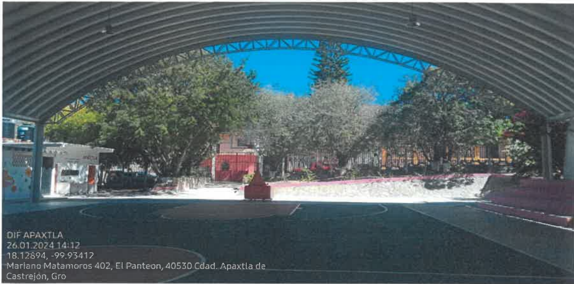
DIF APAXTLA 26.01.2024 14:12 18.12894, -99.93412 Mariano Matamoros 402, El Panteón, 40530 Cdad. Apaxtla de Castrejón, Gro