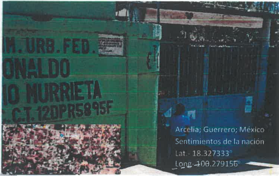
Arcelia; Guerrero; México Sentimientos de la nación Lat. - 18.327333° Long. -100.279155°