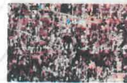
Arcelia; Guerrero; México Sentimientos de la nación Lat. - 18.327333° Long. - 100.279156°