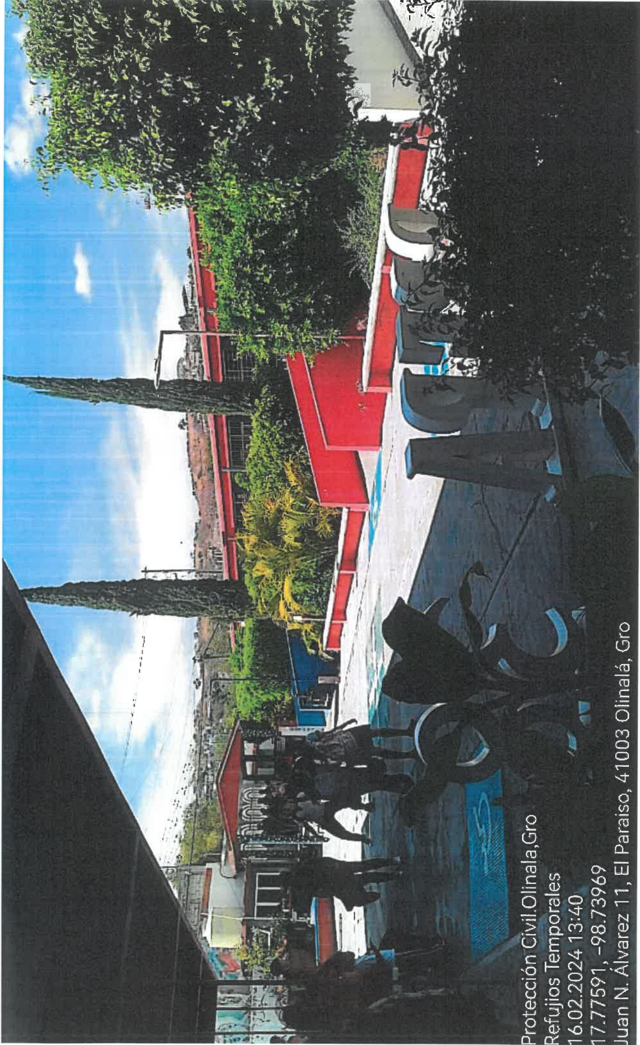
Protección Civil.Olinala,Gro Refugios Temporales 16.02.2024 13:40 17.77591, -98.73969 Juan N. Álvarez 11, El Paraiso, 41003 Olinalá, Gro