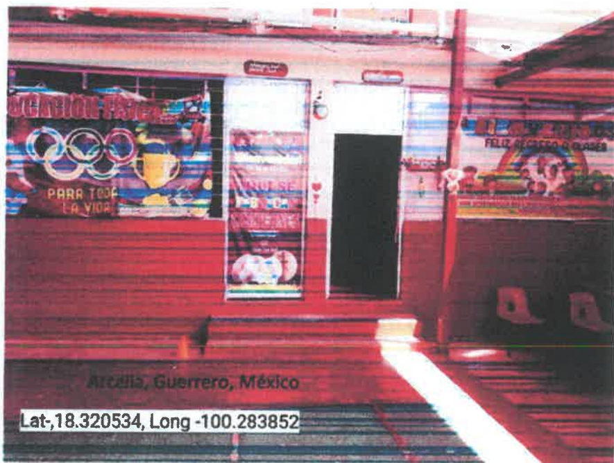
Arcella, Guerrero, México