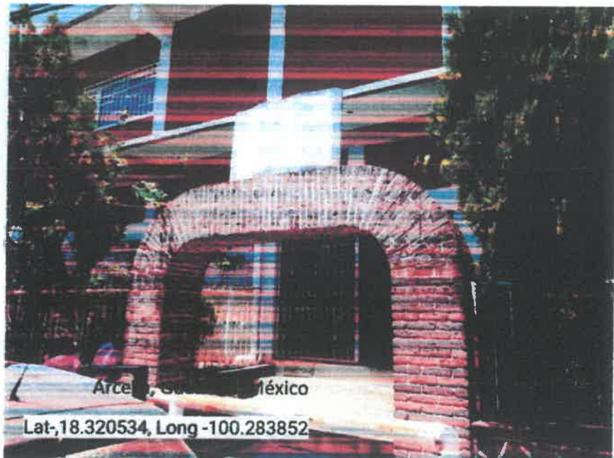
Arcella, Guerrero, México