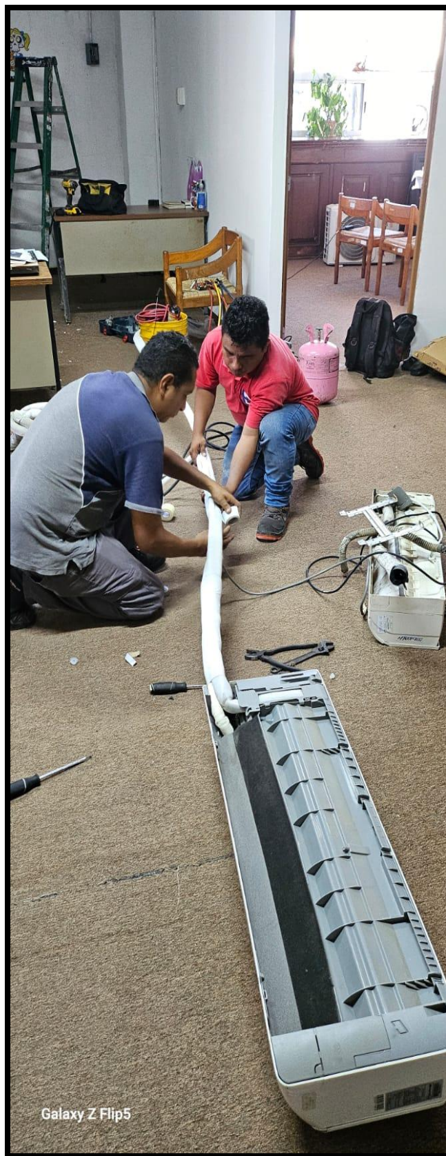
Galaxy Z Flip5