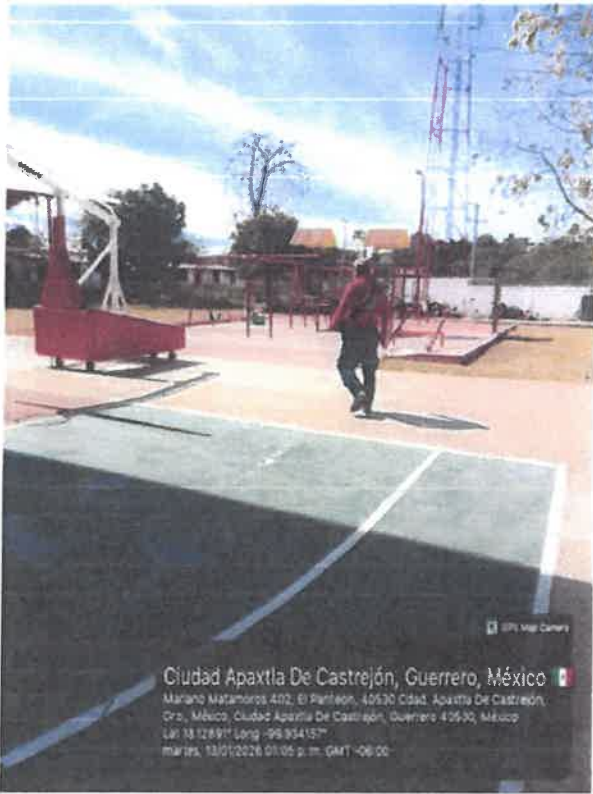
GPS Map Camera Ciudad Apaxtla De Castrejón, Guerrero, México 🇲🇽 Mariano Matamoros 402, El Panteón, 40530 Cdad. Apaxtla De Castrejón, Gro., México, Ciudad Apaxtla De Castrejón, Guerrero 40530, México Lat: 18.128931° Long: -99.834157° martes, 13/01/2026 01:05 p. m. GMT -06:00