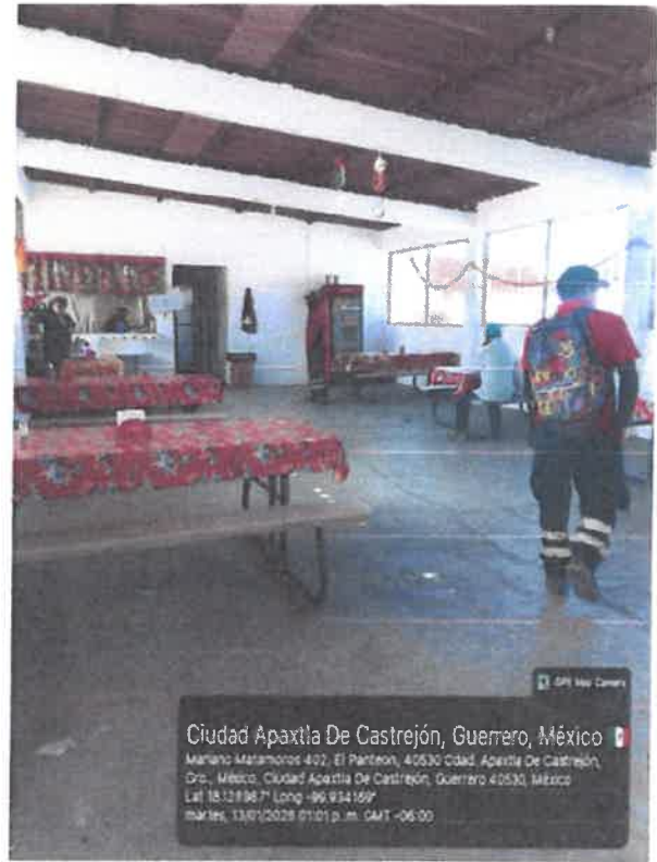
GPS Map Camera Ciudad Apaxtla De Castrejón, Guerrero, México 🇲🇽 Mariano Matamoros 402, El Panteón, 40530 Cdad. Apaxtla De Castrejón, Gro., México, Ciudad Apaxtla De Castrejón, Guerrero 40530, México Lat: 18.128931° Long: -99.834159° martes, 13/01/2026 01:01 p. m. GMT -06:00